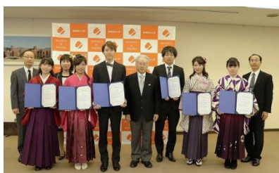
平成 29 年度「特別表彰」受賞者