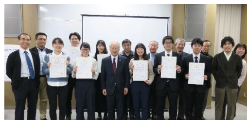
令和元年度 成果発表会後の記念撮影