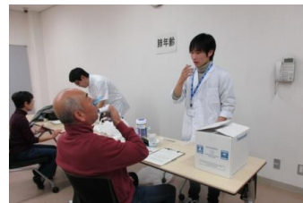
地域住民を対象とした健康増進の啓発事業