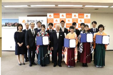
平成 30 年度「特別表彰」受賞者