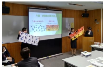
自治体の課題解決に向けた研究発表