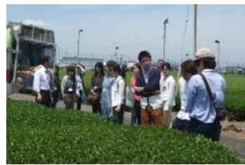
茶畑で地元農家とのワークショップ