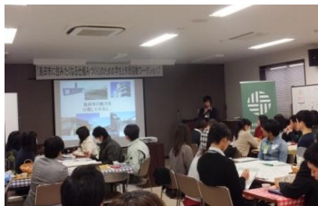
研究成果をもとにした自治体への政策提言