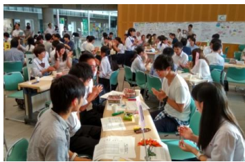
地域における高校生とのワークショップ