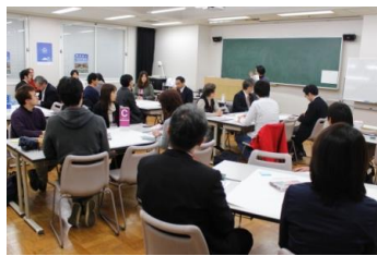
大学における地域住民とのワークショップ