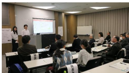
成果発表会の様子

学生のみなさんが年間を通じて取り組んだ地域志向研究／地域貢献プロジェクトの成果を発表する場を用意しています。優れた発表には「地域みらい研究賞」を授与しています。